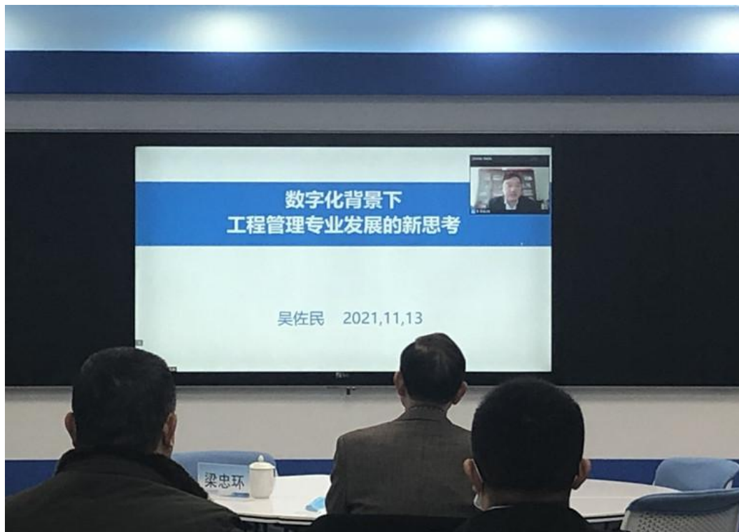
吴佐民教授作报告

吴佐民,北京广惠创研科技中心主任,中国建设工程造价管理协会专家委员会常务副主任,教授级高级工程师。吴教授通过线上方式带来第一个报告,主题为“数字化背景下工程管理专业发展的新思考”。他从深度认知数字化变革的大趋势、准确把握建筑业发展的大方向、培养面向未来的工程管理人才三个方面进行了分享,让我们领略了数字建造的魅力,吴教授提出了对工程管理专业学生的期许,希望学生能成为熟练掌握工程技术和信息技术,精通工程经济与工程管理,成为能够承担项目组织、提升项目价值,真正可以进行工程驾驭的复合型人才。