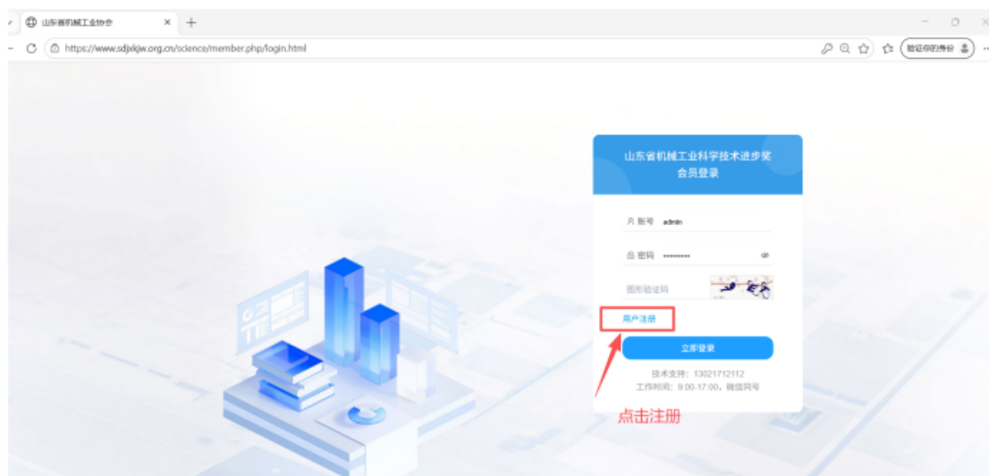
图 2 注册页

https://www.sdjxkjw.org.cn/science/member.php 点击注册，如图 2 所示