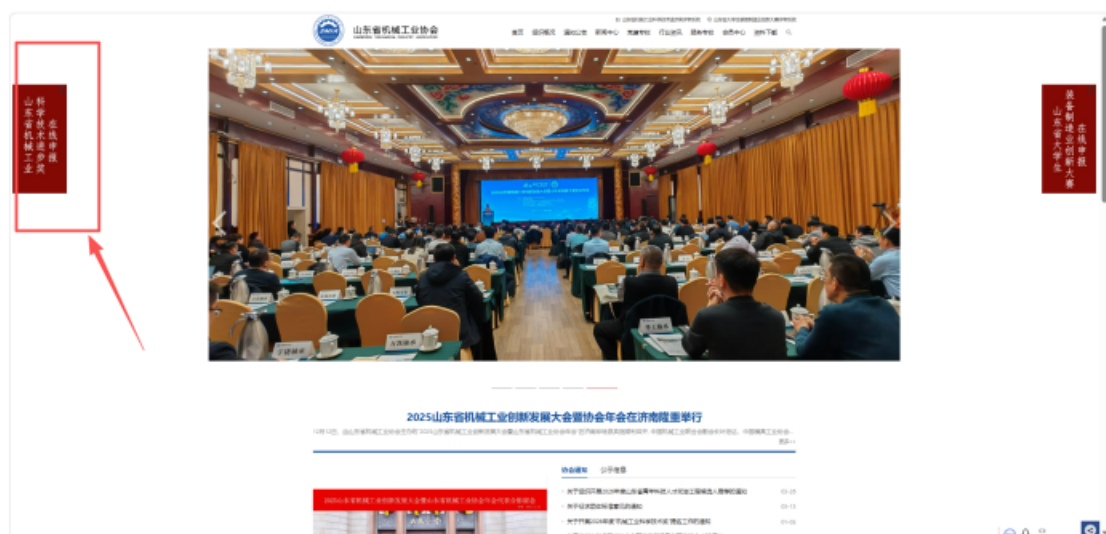
图 1 登陆链接

登陆山东省机械科技网 https://www.sdjxkjw.org.cn/ ，如图 1 所示