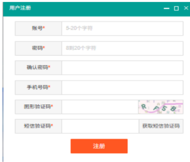
图 3 注册信息